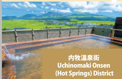
内牧温泉街 Uchinomaki Onsen (Hot Springs) District

阿蘇五岳を一度に望むことができる絶好のビュースポット! 早朝には、雲海が出ることもあります。 A supreme spot to bask in the stunning view of Mount Aso's five peaks. Wake up early, and you might even see a sea of clouds.