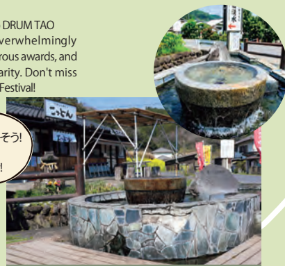
竹田湧水群 (河宇田湧水) Taketa Yusui-Gun (Kawauda Yusui)

阿蘇山系からの伏流水を水源に日本名水百選に選ばれた竹田湧水群の一つ。湧水は高く評価され、この水で育つエノハ料理 (川魚料理) は竹田の郷土料理。