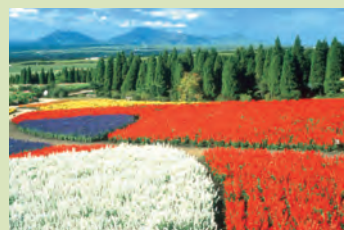
くじゅう花公園 Kuju Hanakoen (flower park)

九州の中心部で雄大な高原に位置する「くじゅう花公園」は年間を通して四季の花々の香りを楽しめます。