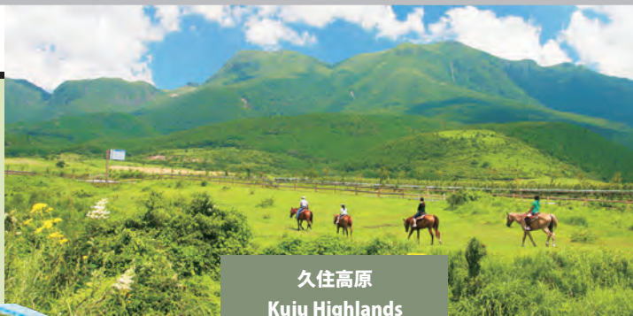
久住高原 Kuju Highlands

広大な緑のパノラマが目の前に広がる久住高原。雄大な景色をカメラに収めたり大自然を感じる乗馬体験も人気です。