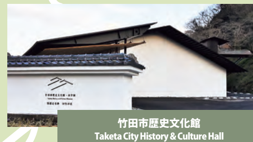
竹田市歴史文化館 Taketa City History & Culture Hall

Nagayu Onsen is blessed with natural sparkling hot spring water, which is rare in the world. One of these facilities, the Lamune (soda) Pop Hot Spring Hall has characteristic cone shaped roofs. You can enjoy the cold bubble fountain bath with silver carbonic acid which clings to your body.