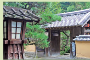
瀧廉太郎記念館 Rentarō Taki Memorial Museum

Known as a hot spring resort for medical treatments from ancient times, is a protected institution. Take your time healing your mind and body, slowly.