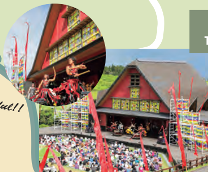
TAO の里 Tao no Sato (Tao's village)

A vast green panoramic scenery awaits you at the Kuju Highlands. Capture the pristine beauty on the lens or enjoy the ever-popular horse riding experiences.