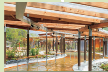
クアパーク長湯 Health Care Resort

Throughout the year, fragrance of flowers of the four seasons can be enjoyed at Kuju Hanakoen (flower park) located in the magnificent plateau in the center of Kyushu.