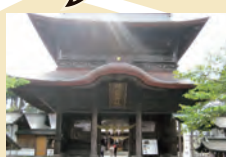
阿蘇神社 Aso Shrine

平成28年の熊本地震により、倒壊した阿蘇神社。令和5年12月復旧完成予定です。 Aso Shrine suffered extensive damage from the earthquake in 2016. Restorations will be finished in December 2023.